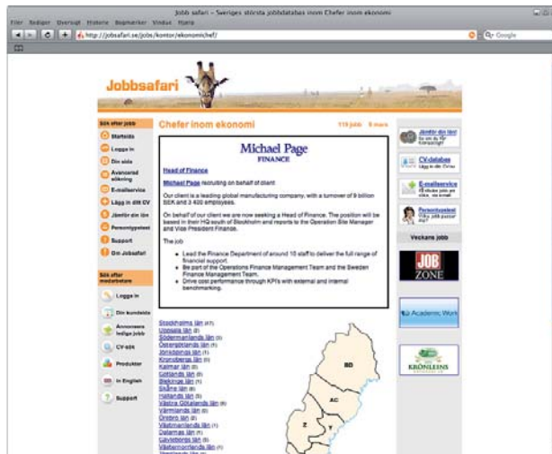
Yrkesannons: 450x250 pixlar

Bli sedd på en kategoriannons eller yrkesannons på Jobbsafari och bli exponerad till en bestämd och utvald målgrupp.