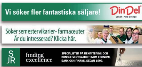
Banner: 468x60 pixlar